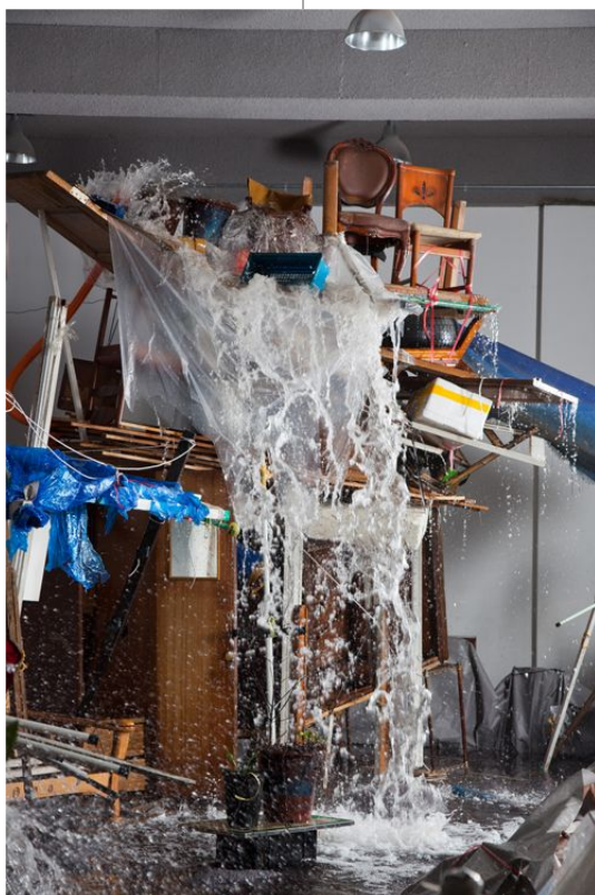
권용주 <폭포-생존의 구조> 혼합재료 1300×500×460cm 2011