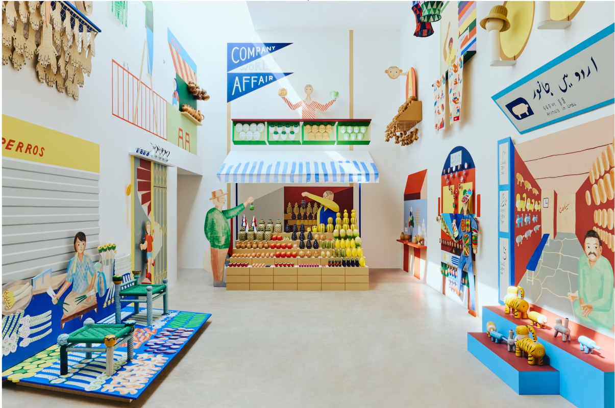
<World Affair>전 전경