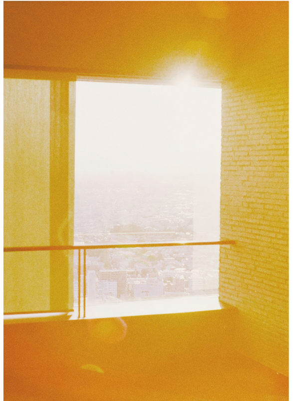
<Daily #2> 사진 2021

황금빛 물결 밀려오는 창 너머로. 도시는 시간을 멈춘다. 이곳은 이다지도 눈부신 봄의 무대, 봄의 환각, 봄의 환희. 네가 물들인 자리마다 꽃은 절정이리니.