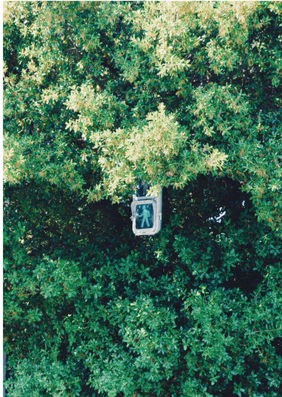
<Daily #1> 사진 2018

나무 사이 숨은 수줍은 초록불 반짝. 햇빛은, 바람은, 잎사귀는 이제 건너시오. 인적이 끊어진 곳. 그리움이 점멸하는, 홀로 오직 너만을 기다리는 깜빡임.