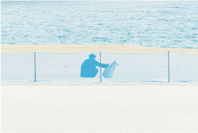
<Daily #1> 사진 2021

일본 포토그래퍼 카네모토 린타로(Kanemoto Rintaro, 1998- 년생). 그의 렌즈는 우리가 무심코 지나치는 도시의 여백을 쫓는다. 텅 빈 객석, 관중 없는 스타디움, 인적이 끊긴 뒷골목, 녹슨 자판기가 놓인 모퉁이.... 소란스럽고 번잡한 빌딩 사이에서 시간이 멈춘 듯한 고요를 카메라로 길어 올린다. 린타로 사진에는 인물이 부재하거나 철저히 점경(景)으로 물러난다. 프레임을 채우는 것은 남겨진 사물과 공간 자체가 내뿜는 미세한 '호흡'이다. 작가는 대상에 내러티브를 부여하거나 특정한 감정을 투영하지 않는다. 피사체와 투명한 거리를 유지한 채, 대상이 지닌 고유한 물성과 리듬을 화면에 수평적으로 나열한다. 이러한 관조는 인간의 해석을 걷어낸 진공의 상태에서 비인간이 지닌 낯것의 존재감을 수면으로 끌어올린다. 봄별을 맞으며 유리와 콘크리트, 플라스틱으로 피어나는 사물의 꽃이여.