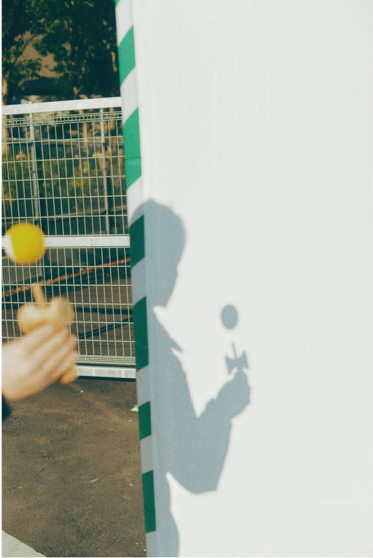
<Spil Kendama Altid Altid> 사진 2018