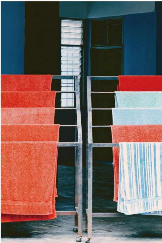
<Malaysia> 사진 2015

나무 사이 숨은 수줍은 초록불 반짝. 햇빛은, 바람은, 잎사귀는 이제 건너시오. 인적이 끊어진 곳. 그리움이 점멸하는, 홀로 오직 너만을 기다리는 깜빡임.