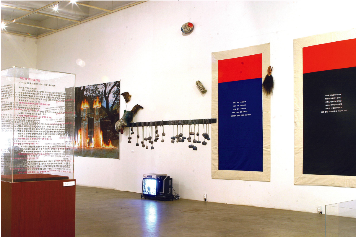
<당신은 나의 태양>전 전경 2004 토탈미술관