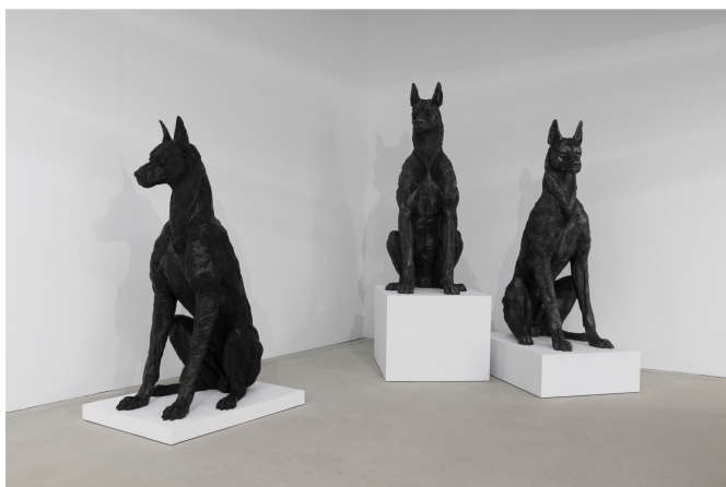
박찬용 <바라보다> 혼합재료 각 80×122×195cm 2022 사비나미술관 제공

미술관의 시간은 '발언'이다. 개관 10주년부터 50주년까지 각자의 좌표에서 한국 동시대미술의 '오늘'을 쌓아온 미술관들이 일제히 기념전을 앞두고 있다. 그 주인공은 사비나미술관, 토탈미술관, 플랫폼엘컨템포러리아트센터(이하 플랫폼엘). 회고가 아닌 질문으로, 아카이브가 아닌 실천으로.... 이들이 시간 앞에 던지는 큐레이토리얼 전략을 하나씩 따라가 본다.