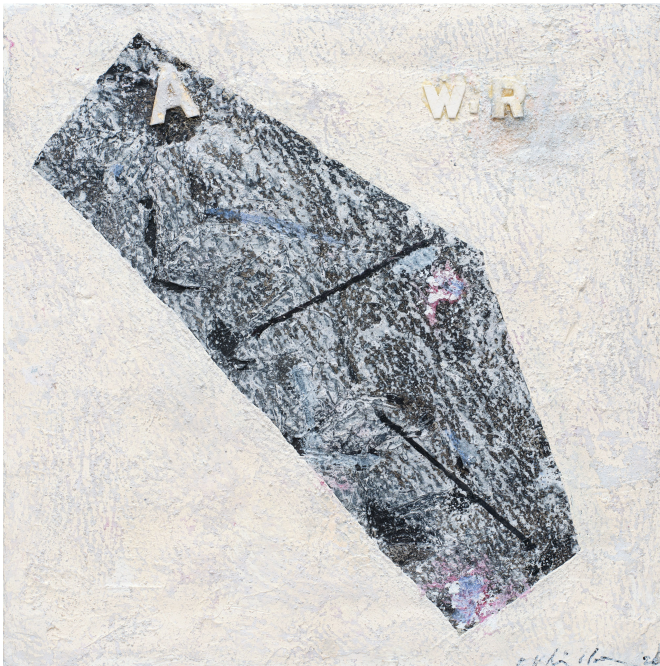
<W. R.> 캔버스에 유채 외 혼합재료 40x40cm 2024~25

이번 전시의 또 다른 출품작 <뚝의 단상>(2005-2006) 역시 배와 뚝, 노마디즘을 모티프로 삼았다. <오딧세이의 배>와 달리 간결해진 선과 확장된 여백이 특징이다. 물감을 쌓고 굳히는 과정을 반복하면서 형성한 두터운 마티에르는 시간의 축적을 물질로 드러냈다. 모래와 시멘트, 안료를 혼합해 화면에 올린 뒤 다시 긁어내는 방식은 생성과 소멸이 교차하는 흔적을 그대로 남긴다. 이러한 표현주의적 제스처가 고스란히 담긴 그의 회화는 안락함이나 달콤함과 거리가 멀다. 베를린 체류 시절, 동독과 서독으로 분단된 냉전의 한복판에서 마주한 현실은 그의 작업 세계를 근본적으로 뒤흔들었다. 무장한 군인의 검문, 도시를 가로지르던 베를린 장벽의 압도적 풍경은 단순한 여행을 넘어선 것이었다. 이때의 기억이 분단 현실을 살아온 작가 자신의 내면과도 깊이 공명해 작업을 하나의 ‘전투’로 바라보는 계기가 되었다. “달콤하고 평화로운 작업은 이 현실에 비해 너무 안이하고 무가치한 것이 아닌가. 나의 작업은 보이지 않는 전장에서 새롭게 무장한 병사에 가까운 것이 되었다.” 이후 작가에게 검은색은 시대의 무게와 존재론적 질문을 담아내는 근간이 되었다. 한때 독일 표현주의 화가 막스 베크만(-Max Beckmann)이 사용한 색채에서 강렬한 인상을 받았다고 밝히기도 했으나 차우희의 검은색은 기본적으로 한국인이라는 정체성에서 출발한다. “내가 구현하는 검정색은 서양에서 받은 영향이 아니라 우리 고유의 감정에서 촉매된 것이다. 오랜 시간을 통해 삭으면서 나타나는 푸근한 정감의 색채다.”