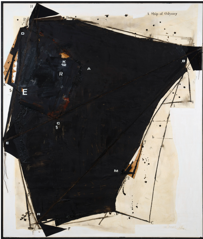
<오딧세이의 배> 캔버스에 아크릴릭 외 혼합재료 213x184cm 1991

1세대 여성 추상화가 차우희. 그는 흑과 백의 강렬한 대비와 그사이를 표류하는 기호를 작업의 핵심으로 삼아왔다. 숫자와 문자, 정체 모를 검은 형태들이 파편처럼 혼재한 화면이 차우희 회화의 시그니처. 정처 없이 떠도는 기호를 통해 작가의 노마딕한 삶을 시각화했다. 그가 개인전 <존재의 지층, 실존적 오딧세이>(3. 18~5. 10 조현화랑 서울)를 열었다. 이번 전시에는 대표작 <오딧세이의 배>(1991)와 프란츠 슈베르트의 연가곡 <겨울 나그네>에서 영감을 받은 신작을 포함한 회화 20점을 공개했다.