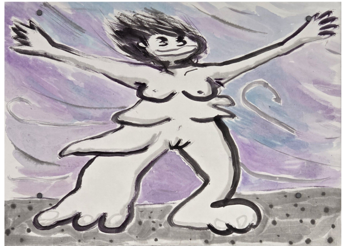
<다 운 여자> 화선지에 잉크, 수채 28×34cm 2025

마지막은 무려 11.4미터에 달하는 대작 <호곡도>(2026). 전시의 긴 서사를 하나로 압축해 마무리한다. 앞선 작품의 인물들을 캐릭터화해 다시 등장시켰다. 작품은 연암 박지원의 『열하일기』 중 “맘껏 소리 내어 울어도 좋은 곳”을 뜻하는 ‘호곡장(胡哭場)’에서 제목을 빌려왔다. 일본의 두루마리 그림인 에마키모노(絵巻物) 지옥도의 동세, 인물 배분을 차용했다. 밀도 있으면서도 즉흥적인 색채를 구사하기 위해 동양화 재료 대신 유화를 택했다. 불지옥 같은 현실을 지나 전진하며 마침내 친구와 극적으로 재회하는 여정을 그렸다. ‘그래도 죽지 말고 잘 살자’는 작가의 절절한 메시지를 압축했다.