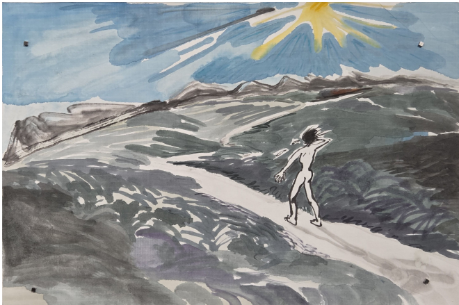
<길이 안 보여요> 화선지에 잉크, 수채 23x34.6cm 2025

화가 이은경. 그는 감정을 숨기는 일이 미덕이 된 세상에서, 그동안 억눌린 '눈물'을 화폭에 거침없이 쏟아낸다. 성별, 경력, 외모를 잣대로 차별받았던 울분의 경험을 모티프 삼아 현대 사회의 구조적 부조리를 폭로해 왔다. OCI미술관에서 이은경의 개인전 <수도꼭지 연대기>(4. 17~5. 30)가 열렸다. 회화에 키네틱 요소를 도입한 대형 설치를 비롯해, 눈물에 얽힌 양가적인 감정을 담은 회화와 드로잉 등 총 69점을 공개했다.