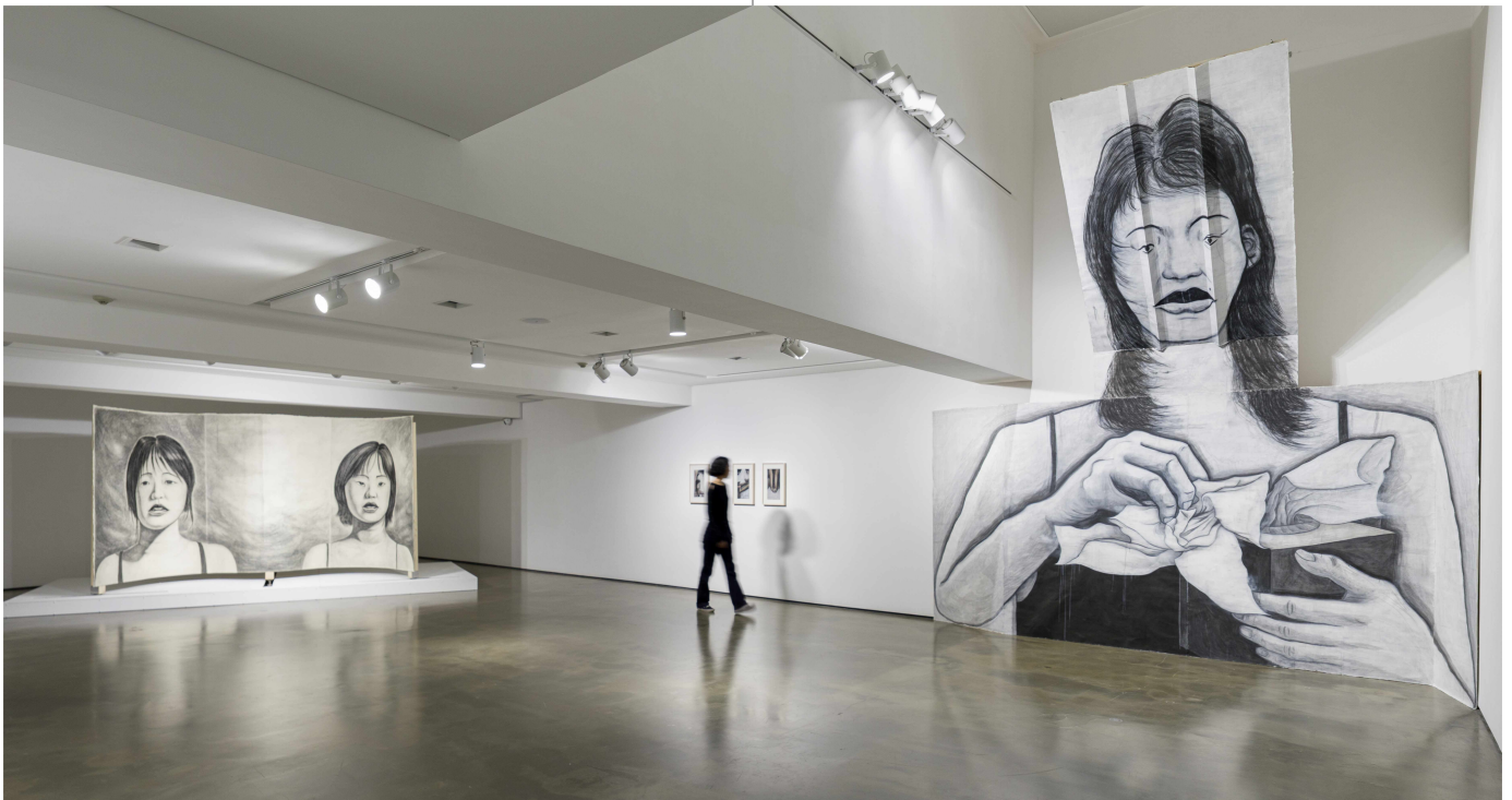
개인전 <수도꼭지 연대기> 전경 2026

전시장에 들어서면 가장 먼저 직관적으로 표현된 슬픔의 감정을 마주하게 된다. 초입에 설치된 <울지 마세요>(2026)는 화면이 접혀있어, 보는 각도에 따라 본래의 우는 얼굴이 미묘하게 찌그러져 억지로 웃는 표정으로 변한다. 눈물과 웃음이 공존하는 삶의 모순을 짚어냈다. 이어지는 <태평양갈고 활화산갈은>(2026)은 평면회화에 움직임과 소리를 더한 키네틱 설치작업이다. 종이의 탄성과 내구성을 활용해 두 인물이 서서히 서로 마주 보게 되는 이 작품은, "우선 마주 보아야 타인의 감정을 발견하고 위로로 연결될 수 있다"라는 작가의 철학이 담겼다. 텍스트나 상징을 사용하는 대신, 사운드와 움직임이라는 간결한 구조로 타인과의 연대에 이르는 과정을 형상화했다. 그 맞은편 공간에는 12인의 우는 표정을 먹과 잉크로 드로잉한 <우는사람>(2026)이 놓였다. 인물의 개별적인 특징을 최대한 덜어내 감상자가 저마다의 내밀한 감정을 화면에 자연스럽게 투영하도록 유도했다. 혼자 우는 일은 외롭고 부끄러운 일일지 모른다. 그러나 함께 울면 슬픔은 더 이상 감춰야 할 약점이 아니라 서로를 단단하게 연결하는 가장 강력한 매개가 된다.