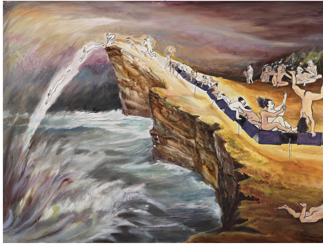
<호곡도> 종이에 유채 57x1,140cm(부분) 2026