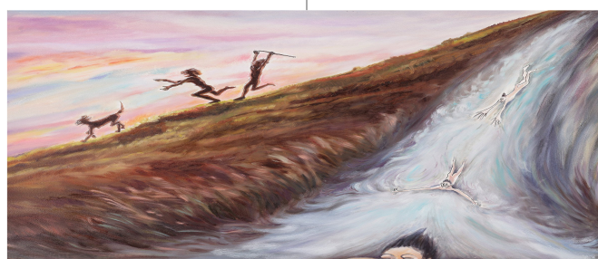
호곡도, 수채, 11.4m, 2026

이은경의 작업은 개인의 불화와 상실에서 출발해 타인을 향한 위로와 접속으로 나아가는 치열한 과정이다. 자신만의 울분을 토해내던 화폭은 이제 같은 구조 속에서 주변부로 밀려난 ‘타자’들의 비애를 끌어안는 연대의 장이 되었다. “과거 학생운동을 한 경험이 있는데, 그 이유가 어떤 정치적 입장이나 이념을 지녀서는 아니었다. 그저 눈앞에 누군가가 울고 있기에, 그걸 견딜 수 없어서 활동했다. 그만큼 나에게에는 눈앞에 있는 사람의 감정이 어떤 것보다도 강력한 동기와 설득력을 지닌다.” 눈물에는 스스로를 구하고, 타인을 움직일 힘이 있다. 그렇기에 작가는 눈물이 나약함으로 치부되는 시대에 기꺼이 ‘울보들의 성지’를 짓는다.